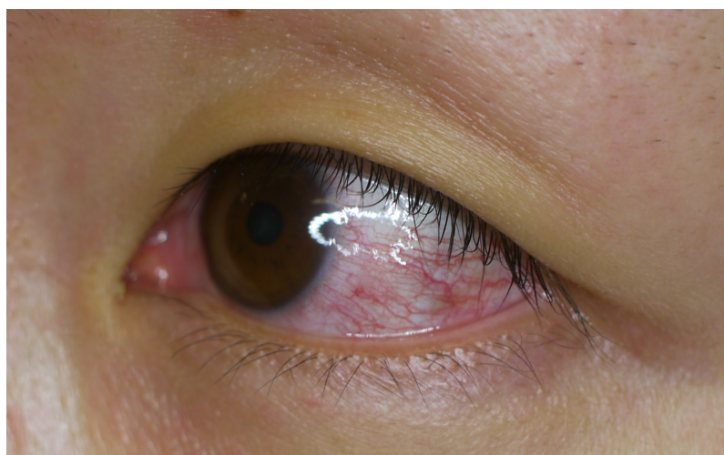
図 4. ジカウイルス病の充血性結膜炎

※ ただし、蚊媒介による国内発生を疑う場合は、1. をおこしうる他の疾患を除外した上で、2. の条件は必須ではない ( 2.1 デング熱②診断「鑑別診断」 を参照)。